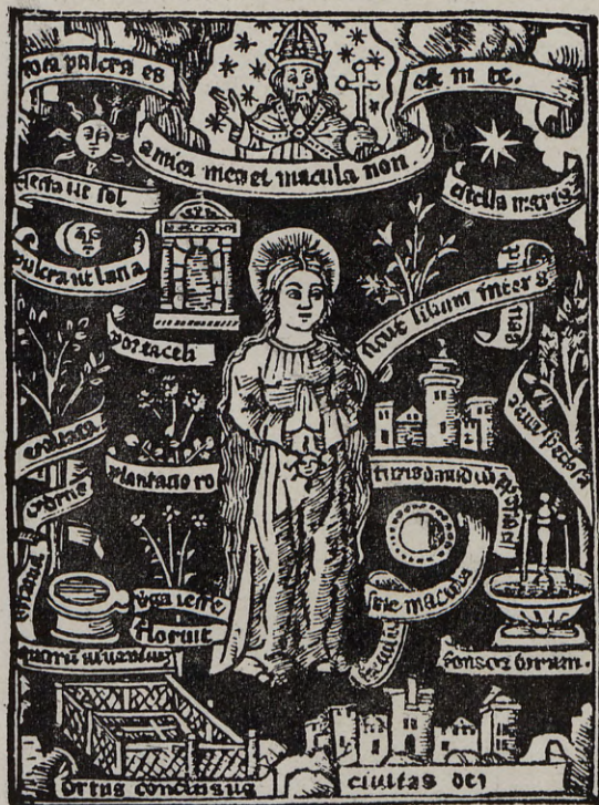
115.—LA INMACULADA CONCEPCIÓN

Cuarto. La Inmaculada Concepción de María . El arte acoge y populariza la idea teológica acerca del misterio de la Concepción. Reproduce, de los tipos icónicos anteriores, en muchos ejemplares, la escena de la Coronación; apó-