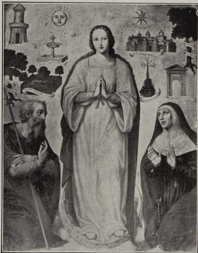
116.—LA PURÍSIMA CON SAN JOAQUÍN Y SANTA ANA Tabla de Juan de Joanes, 1523

La visión celeste del artista al trasladar a la tabla con suaves y límpidas tintas, la excelsa imagen de la Inmaculada, tal como pudo verla en sus espirituales coloquios con el P. Alberro, es todo un poema de ternura, página de sentimiento, arte de cándida unción. Contemple el lector, artista o devoto, esta poética obra. Ella nos transporta a las más elevadas y serenas esferas del amor ideal, amor divino. Para el simple creyente, es manantial inagotable de dones espirituales; para el artista, fuente