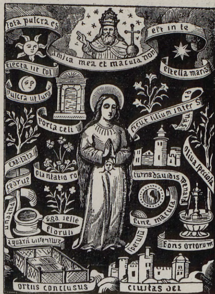
112.—LA CONCEPCIÓN De los Gozos cantados en la Iglesia de la Encarnación, Valencia, 1505

Como un derivado de toda esa literatura, tanto la nacional como la extranjera, podemos señalar el proceso icónico de la Virgen hasta llegar a la forma sintética de la Inmaculada Concepción. Enestelar-