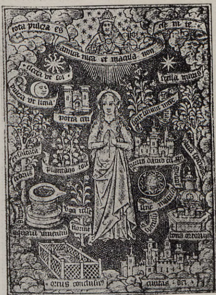
110.—LA INMACULADA CONCEPCIÓN Thilman Kerver, París, 1505

No tenemos el propósito de aumentar una página en la iconografía de la Concepción. Sólo pretendemos dar a conocer algunos documentos relacionados directamente con la peregrina Purísima de nuestro Joanes, venerada en la capilla existente en la iglesia del Sagrado Corazón de Jesús de Valencia, conocida desde antiguo con el nombre de la Compañía, por haber sido el primer templo que levantaron los hijos de San Ignacio. Vamos, pues, a reseñar las vicisitudes de esta obra, especialmente en dos períodos históricos de notoria importancia, como lo fueron la extinción de los regulares de la Compañía de Jesús, decretada por Carlos III en 1767 y el derribo del templo, donde la imagen recibía culto público, en Octubre de 1869. Surgen en