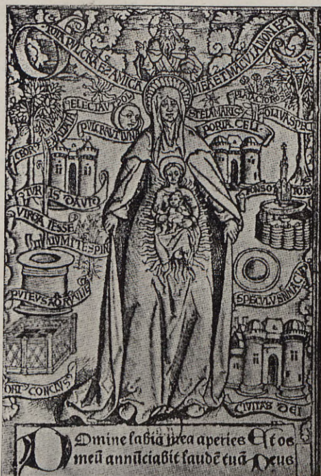
111.—SANTA ANA, CON LOS EMBLEMAS DE LAS LETANÍAS Simón Vostre, París, 1510

magnates (1) . Recordemos la génesis literaria de esta devoción en la ciudad del Turia. Guirnalda poética, consagrada a la Virgen, fué el primer libro impreso en