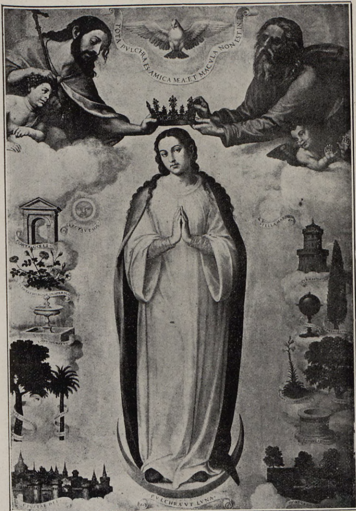
115.—LA PURÍSIMA DE JOANES Iglesia del Sagrado Corazón de Jesús, Valencia

Tanto en la estampa de París de 1505, como en las de Valencia de idéntico asunto, la composición corresponde por completo a la imagen ideal de la Concepción. Pero la característica de esta representación gráfica, conforme a la idea expresada por la liturgia, tiene su origen en conceptos y emblemas bíblicos, tomados, casi todos, del Cantar de los Cantares . La Sulamita es la Inmaculada y por esto el Padre Eterno, desde lo alto, la bendice con las palabras del Cantar: «Tota pulchra es, amica mea, et macula non est inte» y se agru-