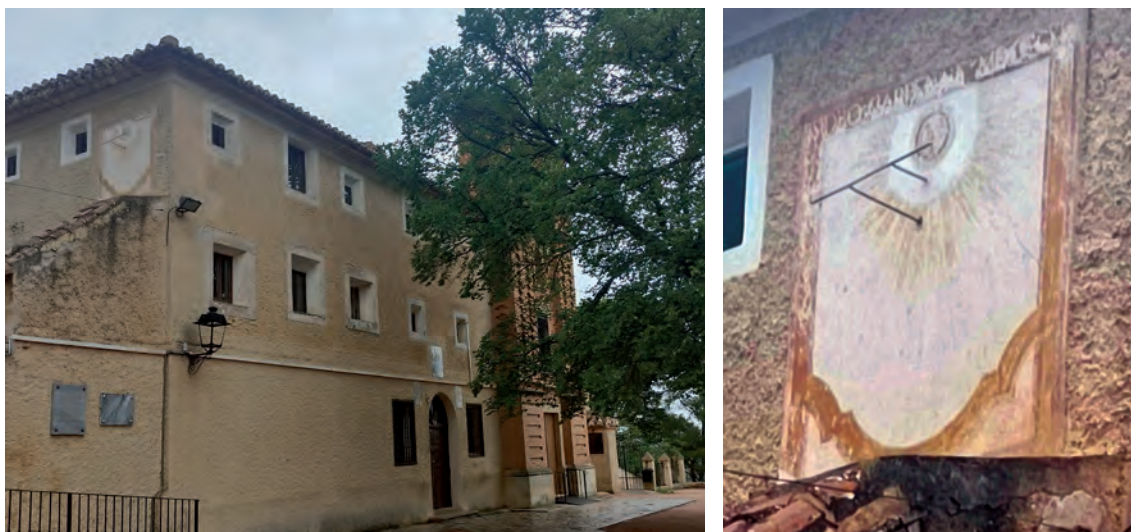
Figs. 8A y 8B.- Jumilla: Convento franciscano de Santa Ana del Monte . Detalle del reloj de sol de un solo cuadrante, pintado por Isidro Carpena en 1812 en un rectángulo enlucido del edificio conventual. Fotografías: Javier Delicado / Vicente Talón, 7/16/2023.