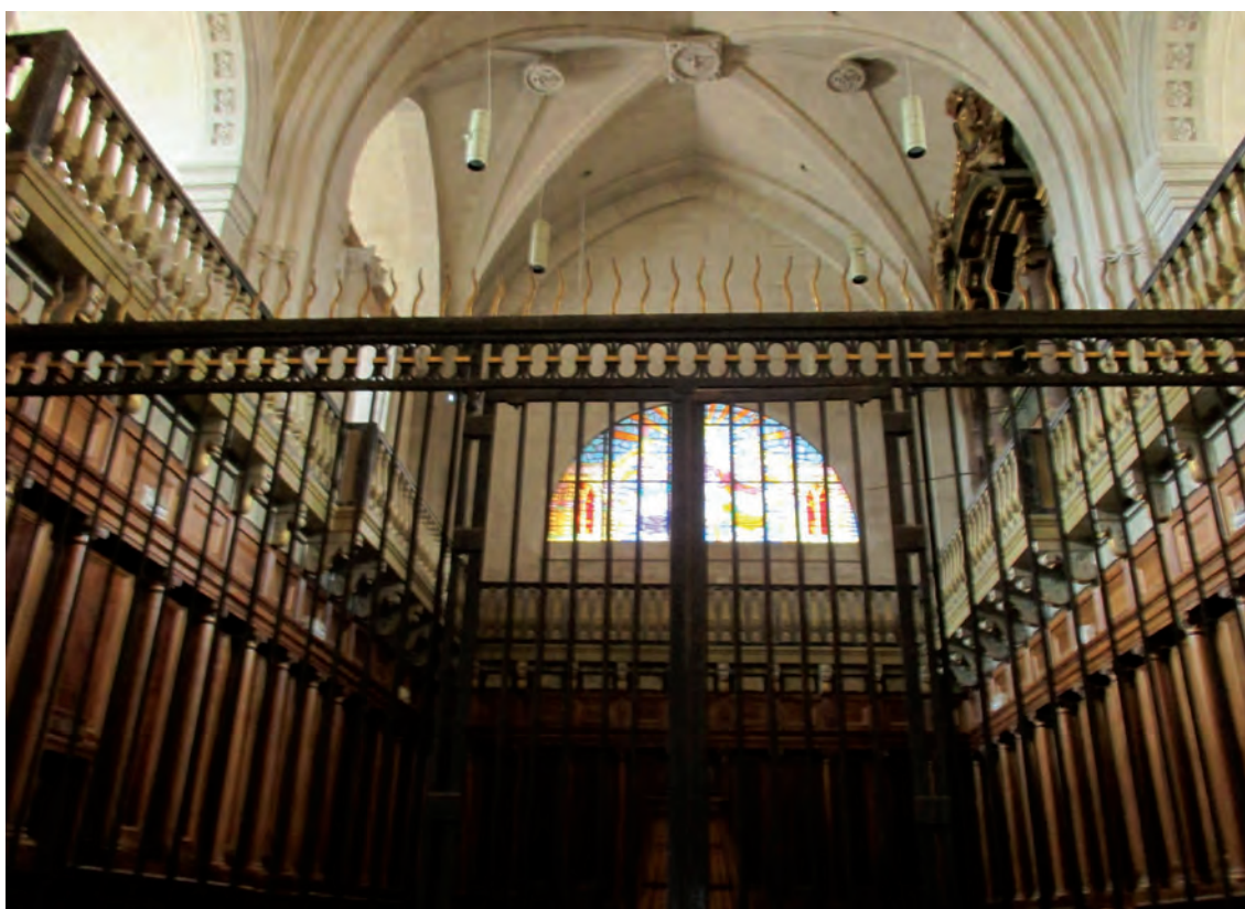
Fig. 4.- Jumilla. Iglesia mayor de Santiago Apóstol , Detalle de la reja del coro neoclásico situada a los pies del templo, pintada por Isidro Carpena.

láminas de oro a través de la técnica del punteado, del retablo bifronte 45 de la Capilla de la Venerable Orden Tercera o de Nuestra Señora de los Dolores o Angustias, de la Iglesia conventual de San Francisco de Asís (FIGS. 5A y 5B), que presenta doble cara ornamental y fue ajustado en 6.900 reales de vellón, abonados en cuatro plazos, y consta documentado en el acta de la Junta de 5 de septiembre de 1773, del Libro de Actas y Decretos de la Venerable Orden Tercera de Penitencia de Nuestro Seráfico Padre San Francisco de la Villa de Yecla (1720-1788) . Ms, folio 187 vº, que a la letra dice: