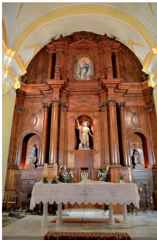
Fig. 2.- Alatoz (Albacete): Iglesia parroquial de San Juan Bautista. Retablo mayor diseñado por el arquitecto Lorenzo Alonso Franco y confeccionado en madera por Isidro Carpena. Años 1805 y 1806.

Según la profesora Concepción de la Peña Velasco 29 , en 1806 consta documentalmente que