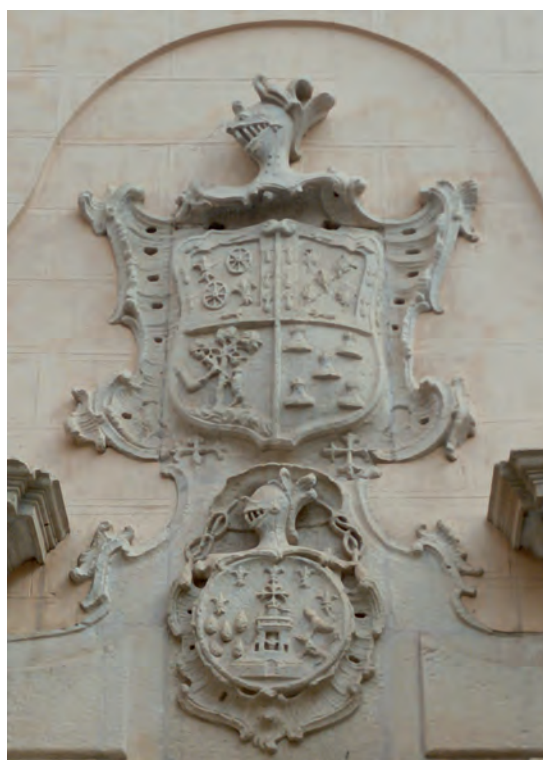
Figs. 6A y 6B.- Yecla: Casa-palacio de los Ortega-Portillo, hoy Casa Municipal de Cultura, Detalle de los escudos de armas de los Ortega, tallados sobre piedra arenisca procedente de Elche en 1793.