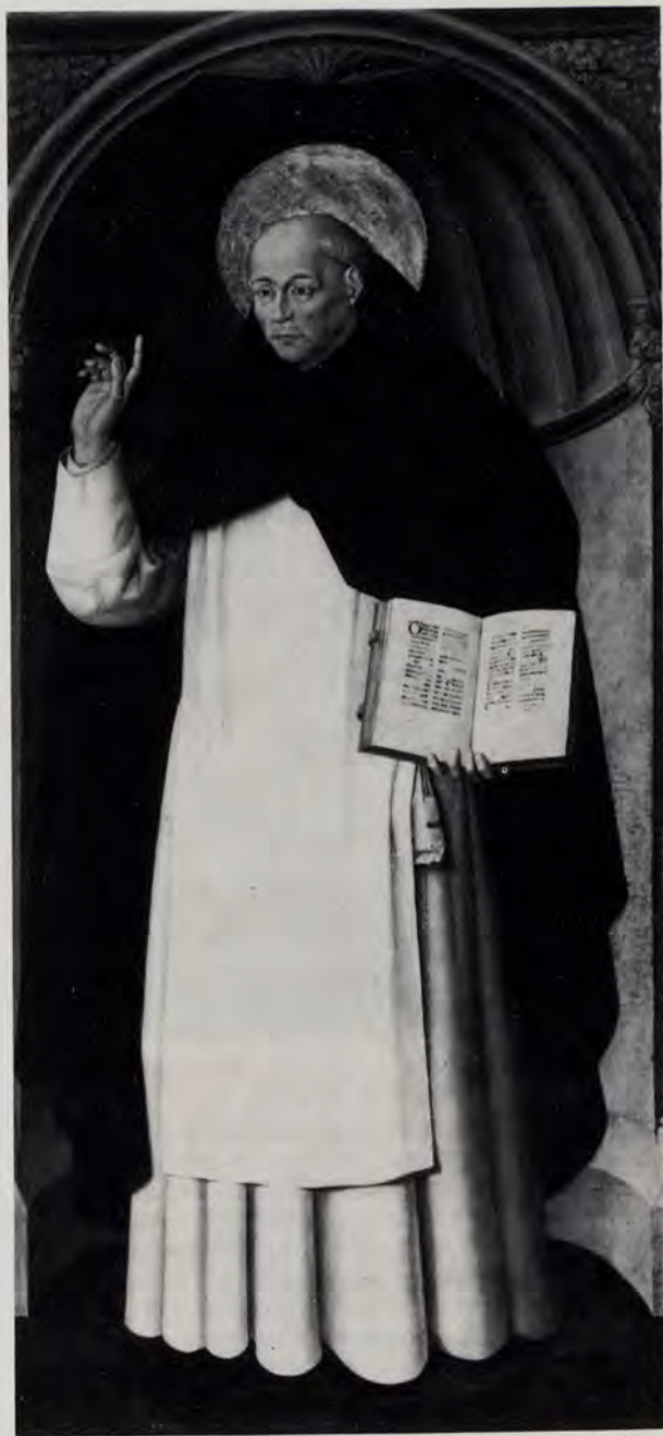
«San Vicente Ferrer», de pintor catalán de final del siglo XV, tabla, anteriormente atribuida al napolitano Co'antonio. Convento Dominico de San Pedro Mártir, Nápoles.

Siguiendo la estela ribalteña, doy fin a este trabajo con la noticia de lienzos de Senén Vila recientemente identificados: tres retratos en el palacio Guevara, de Lorca, firmado y fechado sólo el del centro