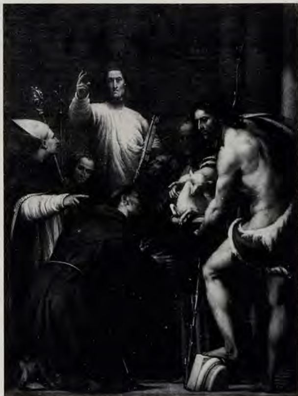
G. A. Porcenone: «San Lorenzo Justiniano y santos» (San Juan Bautista, San Agustín, San Francisco, San Antonio y dos canónigos de San Jorge in Alga, de Venecia). Academia de Bellas Artes de Venecia