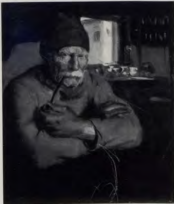
«Pescador de Burano», por José Ros Ferrandis

Luego se recubrió este tipo de arcillas, después de una primera cocción para eliminar el agua química de su composición, con una capa de silicato de plomo y estaño, y sobre ella se decoraba con los óxidos metálicos ya mencionados, más un tono amarillo opaco (antimonio de plomo) y un naranja (antimonio de plomo y hierro). Así se decoró la cerámica en Italia, Francia, España, etc., hasta fecha no lejana en que se consigue separar el níquel del cobalto,