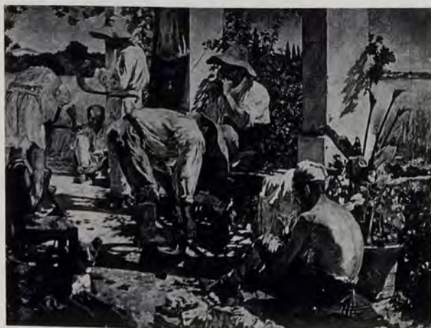
«Segadores castellanoss», por Vicente Castell. Museo Provincial de Castellón.

Estaba en posesión de las siguientes recompensas: 1898. Medalla de bronce del Ayuntamiento de Barcelona, por su cuadro con el tema de una operación