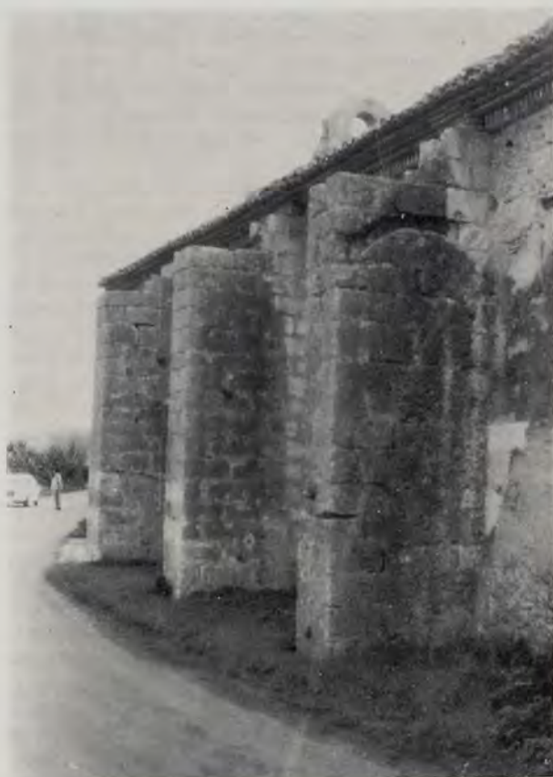
Contrafuertes laterales del templo de Ternelles

Al exterior, los bordes laterales de la techumbre asoman por encima de los contrafuertes en una cornisa de sencilla fina labor de ladrillería mudejarizante, con ladrillos de canto a modo de mútulos; otros, planos y esquinados, como puntas de sierra, y sobre ellos otros igualmente planos, unidos por los lados, que ofrecen como una pequeña moldura lisa o listel continuado, encima del cual asoma la teja árabe. La fachada, muy posterior, barroca, con espadaña, tiene un perfil superior ondulado que corona todo el hastial, en el que hay un panel moderno, sin interés, representando al último titular del templo, San Roque, pues antes lo fue San Bartolomé. Ribetea toda la parte