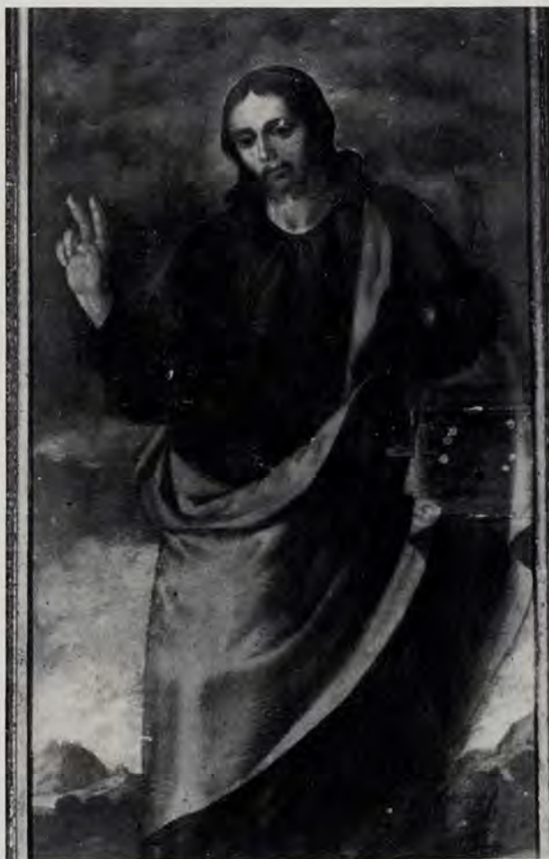
«Cristo Redentor», anónimo valenciano de fines del siglo XVI, tabla. Propiedad del autor.