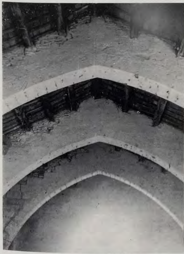
Arcos protogóticos del templo de Ternelles

superior de esa fachada un perfil de ladrillo tabicado.