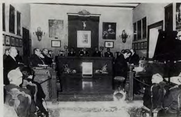
Interpretaciones musicales en la sesión conmemorativa del segundo centenario del músico y compositor Ludwig von Beethoven.