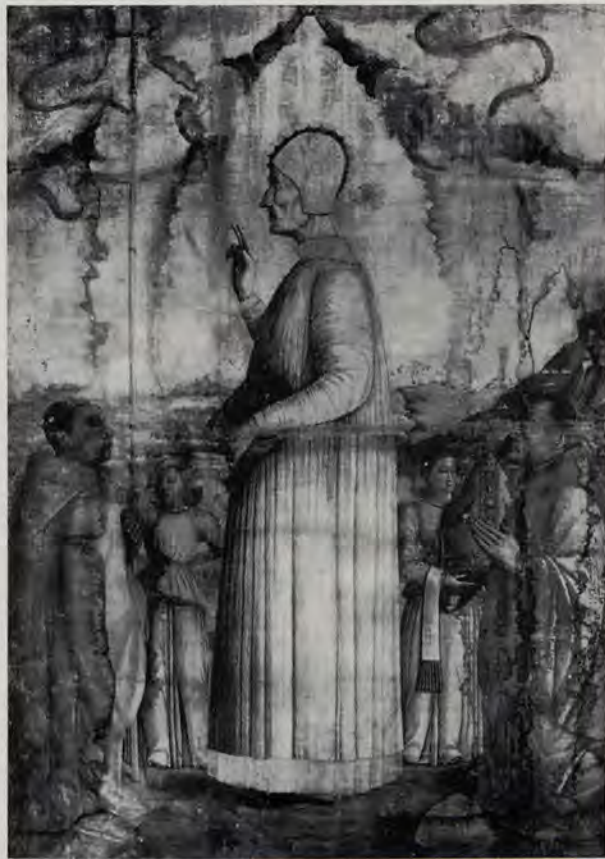
«San Lorenzo Justiniano», primer patriarca de Venecia, por Gentile Bellini, 1429-1507. Academia de Bellas Artes de Venecia.

(3) Los capuchinos de Orihuela poseen un grupo recientemente ejecutado de Cristo dando la sangre al Patriarca San Juan de Ribera, arrodillado sosteniendo un cáliz.