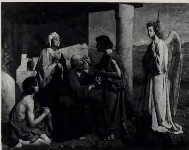
«La curación de Tobías», óleo de Agrasot.

En lo referente a los temas costumbristas no va-