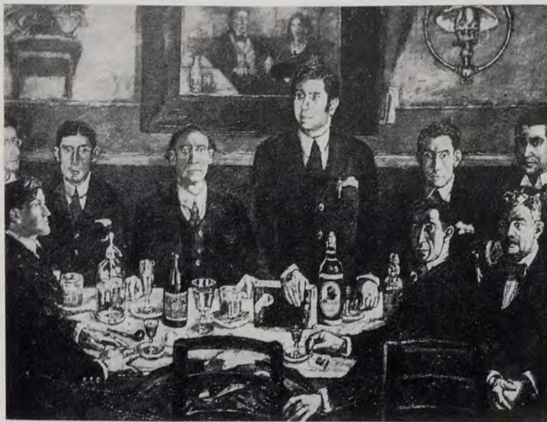
«La tertulia de Pombo», por Gutiérrez Solana

son muchos los catalanes, casi todos barceloneses y de familias acomodadas, que alcanzan categoría universal, destacándose por lo que hoy diríamos «aperturismo», pues la gran urbe barcelonesa del 900 fomenta el cultivo de todas las novedades, al tiempo que sus arquitectos, Gaudí sobre todo, también Domènech y Muntaner, dan nuevo y original impulso al llamado «modernismo», o «Art Nouveau» en Francia, «Modern Style» en Inglaterra o «Jugendstil» en Alemania. José María Sert y Badía, barcelonés (1874-1945), hijo de ricos fabricantes, es el único decorador en el mundo que conserva el ímpetu de Tiépolo y de Goya; cubre extensiones inmensas de muros y de techos en inmuebles tan relevantes como el palacio de la Sociedad de las Naciones, en Ginebra; el hotel Waldorf-Astoria y el edificio Rockefeller, ambos en Nueva York; varios palacios de París, Londres, Madrid y Palma de Mallorca; la gran iglesia del Museo de San Telmo, de San Sebastián, y el Ayuntamiento de Barcelona (salón de las Crónicas), y sobre todo, la catedral de Vich, cuya total decoración planeó tres veces y realizó dos por haber sido destruida en la guerra de España. Su arte, opulento y magnífico,