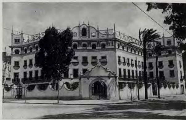
Centro de Protección Maternal e Infantil Virgen de los Desamparados (La Cigüeña), en Valencia.