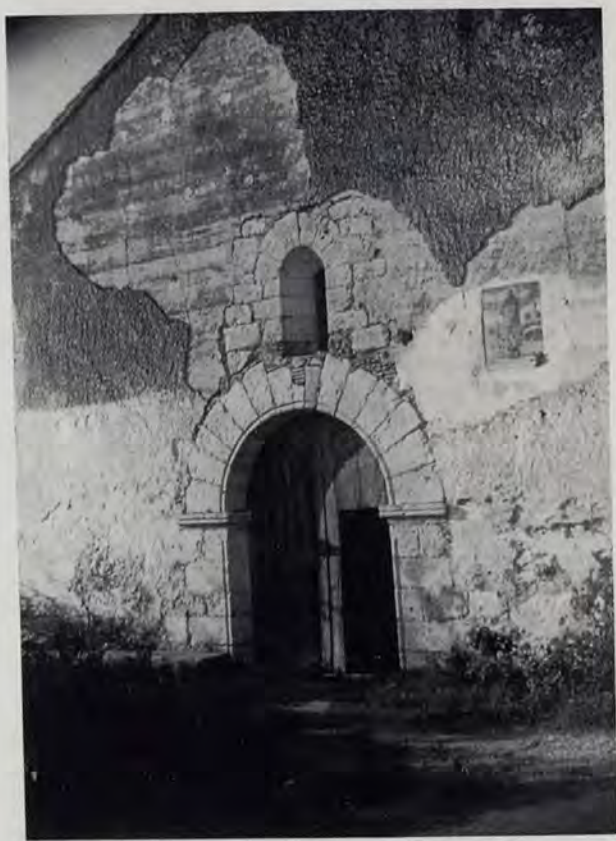
Portada románica del templo de Ternils (Carcagente)

Lo tardío de la Reconquista de Valencia-Reino impide casi totalmente, o poco menos —sobre todo al sur del Mijares y aun quizás más arriba, en cuanto constituye la Plana—, una floración regular del románico. Intuyendo un poco eso que alguien llamó la