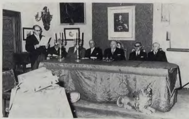
Solemne acto inaugural del ejercicio académico del año 1971

so XIII». Fue una oración brillante, cautivadora por los recuerdos, aleccionadora por las descripciones de más de un centenar de glorias de la pintura, cuya síntesis, por el espacio, es difícil de reseñar, máxime cuando una amplia referencia del trabajo se publica en este número de nuestra revista. El análisis de sus respectivas características fue la base para que, ilustradas por la erudita voz del gran historiador de arte y preclaro prócer, fueran enriquecidas y aparecieran en el relato con amplios datos biográficos y curiosas anécdotas, en su mayoría desconocidos. Una gran salva de aplausos, muy merecidos, premió esta magnífica lección. El presidente de la Academia, Sr. Goerlich, agradeció al ilustre orador la muy brillante oración pronunciada, y acto seguido