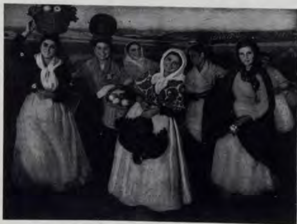
«La vuelta de la fiesta», por Eugenio Hermoso, Museo de Arte Moderno, Madrid.

famosa oposición para la pensión a Roma, Manuel Benedito y Eduardo Chicharro (1873-1952), pintor éste algo literario, cuya obra va a oscilar entre la mitología oriental, el prerrafaelismo inglés y el hondo realismo hispánico. El otro competidor, el valenciano Manuel Benedito, ya aludido (1875-1963), discípulo de Sorolla, fue el más brillante retratista de la época de Alfonso XIII, y su arte, con gran fuerza de dibujo y un sabio «corte» del cuadro, oscila, al decir de un crítico actual, entre el optimismo y la elegancia. Otro valenciano, aunque nacido en Roma, José Pinazo Martínez (1879-1934), siguió la senda del luminismo sorollista, como el malogrado Peppino Benlliure (1884-1916), también valenciano de Roma, pasando aquél, luego, al estructuralismo postimpresionista un poco congelado. Más en la línea sorollista, a su modo, José Mongrell (1870-1934) supo evolucionar también a un postimpresionismo, muy personal, que en la Generalidad de Barcelona se hace decorativo. Con estilo propio, que le valió en 1948 la medalla de honor, máximo galardón que tantas grandes figuras no alcanzaron, el extremeño, de Frenegal de la Sierra, Eugenio Hermoso (1833-1963), algo «primitivo» y de cromatismo ingenuo, pinta preferentemente los juegos infantiles de las muchachitas de su región, como en A tapar la calle , La Juma , la Rufa y sus amigas , etc. Y en Gibraltar nace el español nacionalizado Gustavo Bacarissas, pintor centelleante, un