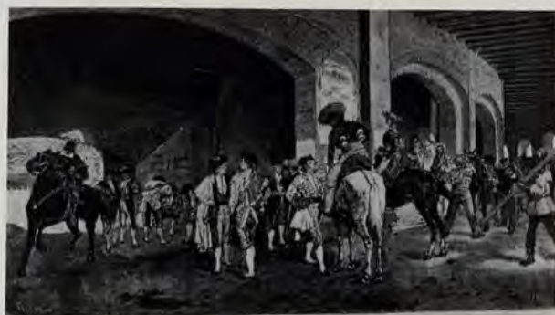
Agrasot: «Antes de empezar..., en la plaza de Valencia»

Un hombre, pues, honrado. Un alicantino ilustre. Un oriolano de talla —y aquí viene la referencia