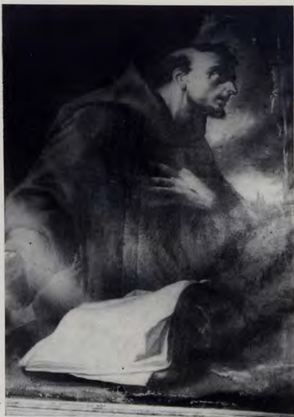
«San Francisco», pintura milanesa con tonalidades venecianas. Coro alto del convento de monjas capuchinas de Murcia.