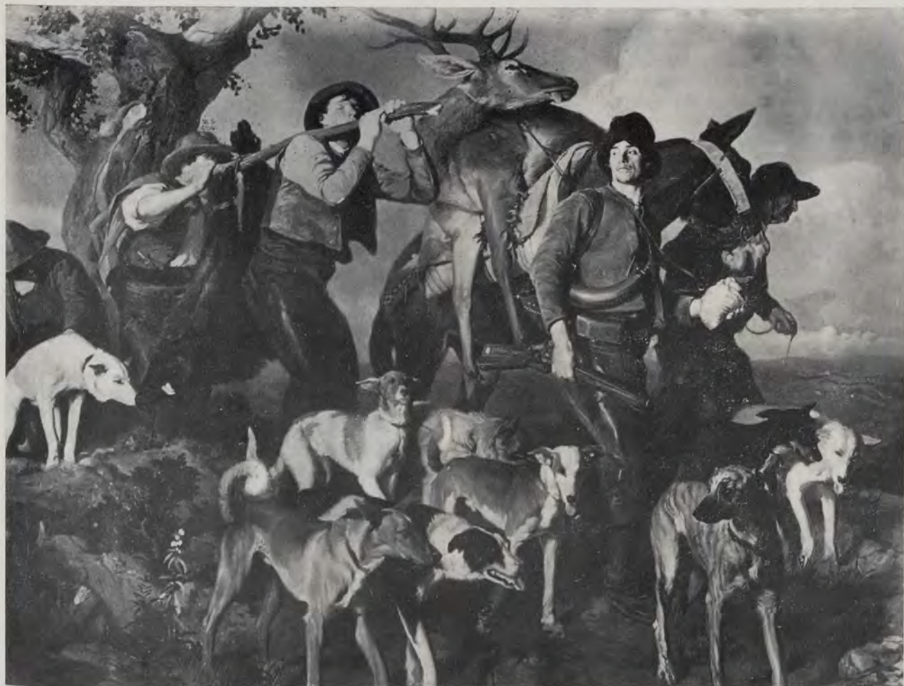
«La vuelta de la montería», por Manuel Benedito

Anglada Camarasa (1872-1958), barcelonés asimismo, que hizo brillar en las grandes exposiciones internacionales, como unos verdaderos fuegos de artificio, sus lienzos deslumbrantes, cuya obsesión, primero, por los retorcidos olivos de Mallorca y, luego, definitivamente, por la espejeante indumentaria típica valenciana —tan propicia para su arte— es bien conocida y tanto contribuyó —con el famoso pasodoble Valencia , de Padilla, en la llamada belle époque — al prestigio internacional de esta tierra del este español, en toda su dimensión regional, pues los nombres de Liria, Burriana, Gandía, Valencia misma, forman parte de los títulos de algunas de sus más luminosas y mágicas composiciones. En Cataluña pintan también por ese tiempo las figuras insignes, renovadoras algunas, de Isidro Nonell (1873-1911), artista excepcional, amigo de Pissarro, y cuya temática, muchas veces un tanto «de protesta», se hace a la vez más penetrante y sutil por la maestría y la sensibilidad del que es pintor « i prou », según decía... Ramón Casas