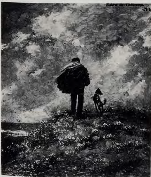
«Mirando al mar», por Pedro de Valencia

Los personajes de la pintura de Pedro de Valencia habitan en casas desde cuyas ventanas se atalaya el mar azul. Los personajes de la pintura de Pedro de Valencia habitan en casas sobre cuyos tejados se cierne el cielo azul por el que cruza una nube grávida