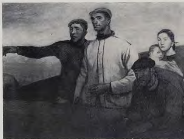
«Pescadores», por Arteta. Museo de Bilbao