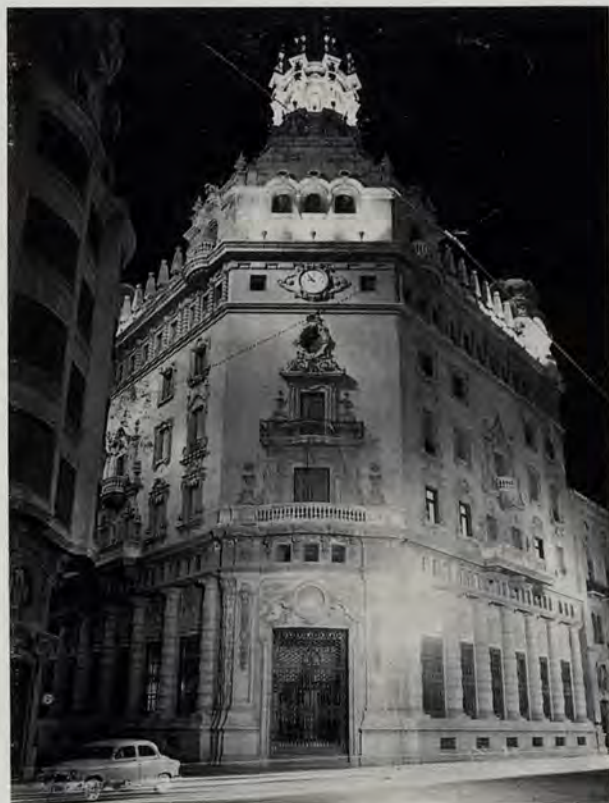
Casa central de la Caja de Ahorros y Monte de Piedad de Valencia