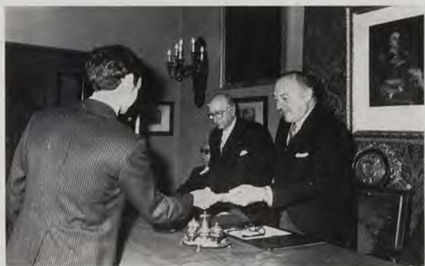
Reparto de premios en el acto inaugural del ejercicio académico del año 1971.

te de la Real de la Historia de Madrid; el alcalde de Albaida (ciudad importante de la provincia y lugar de nacimiento del homenajeado); el director decano del Centro de Cultura Valenciana, Barón de Terra-teig, y otras distinguidas representaciones culturales de Valencia y gran número de académicos.