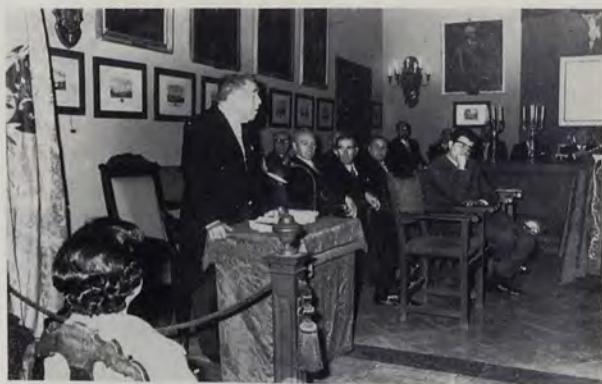
El Excmo. Sr. Marqués de Lozoya durante la intervención en el acto inaugural del ejercicio académico de 1971.

so XIII». Fue una oración brillante, cautivadora por los recuerdos, aleccionadora por las descripciones de más de un centenar de glorias de la pintura, cuya síntesis, por el espacio, es difícil de reseñar, máxime cuando una amplia referencia del trabajo se publica en este número de nuestra revista. El análisis de sus respectivas características fue la base para que, ilustradas por la erudita voz del gran historiador de arte y preclaro prócer, fueran enriquecidas y aparecieran en el relato con amplios datos biográficos y curiosas anécdotas, en su mayoría desconocidos. Una gran salva de aplausos, muy merecidos, premió esta magnífica lección. El presidente de la Academia, Sr. Goerlich, agradeció al ilustre orador la muy brillante oración pronunciada, y acto seguido