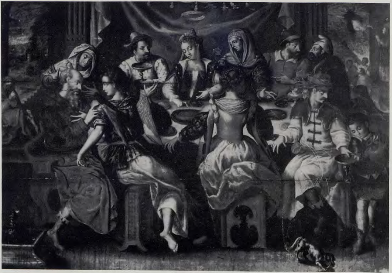
«Historia de Tobías», de Marten van Heemskerck, 1498-1574 (escuela holandesa). Museo de Bellas Artes de Valencia

fael (9), escena que nuestro artista sitúa a la derecha, en un plano más lejano.