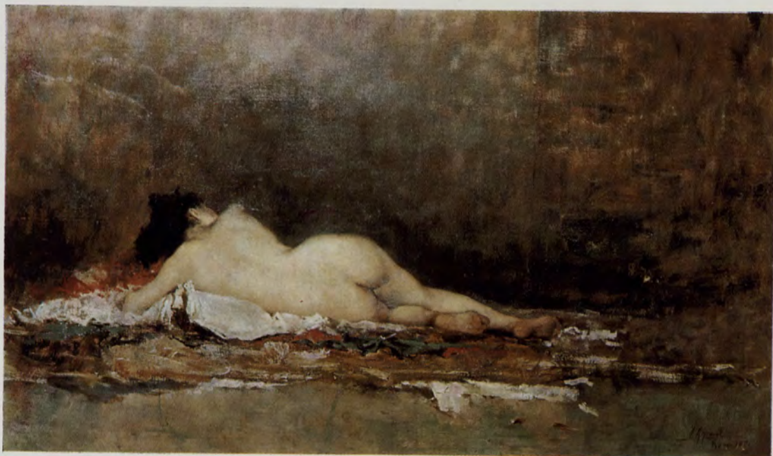
«Estudio de desnudos», Joaquín Agrasot. Por cortesía del Excmo. Ayuntamiento de Orihuela