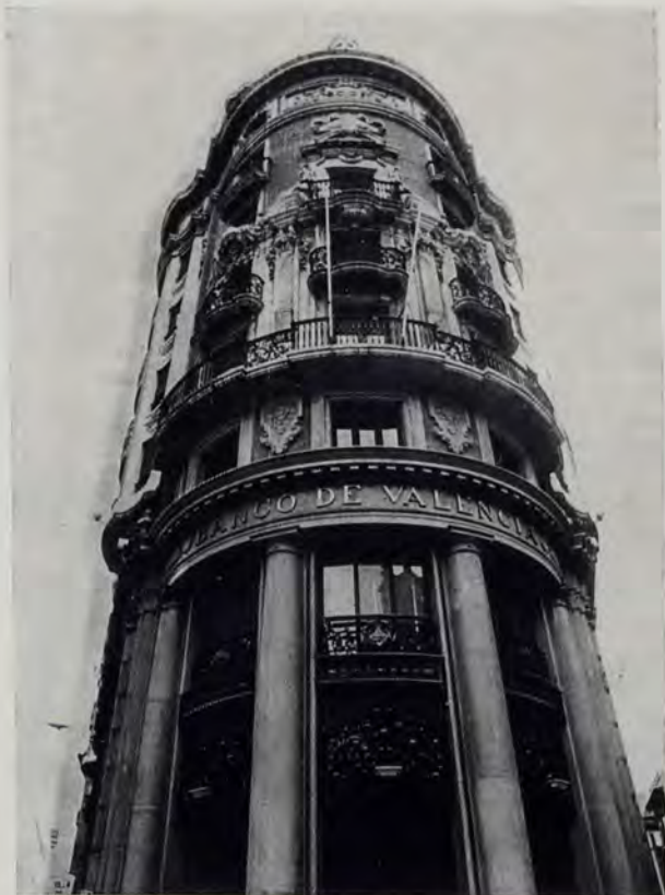
Edificio central del Banco de Valencia (en Valencia)

incluso las de la supeditación a lo social, más modernas, quedaban aludidas.