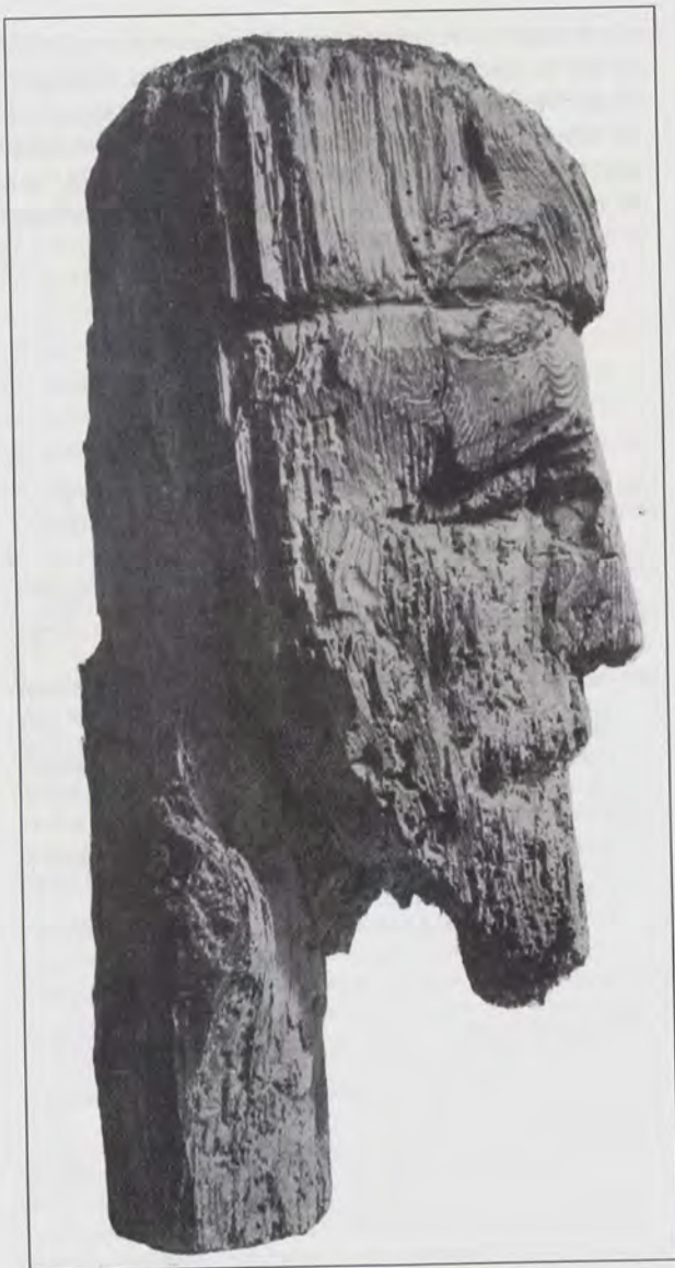
Rafael Pi Belda, Cabeza , 1960

luces y colores que quedan expuestas a los más diversos aires, a las confluencias que quisiéramos más arriesgadas" (50) .