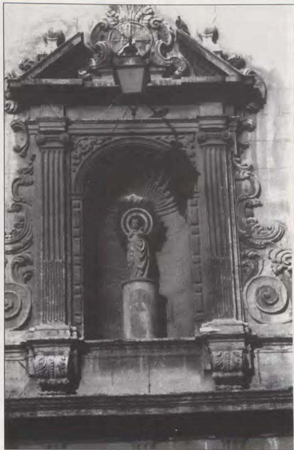
Iglesia del Pilar. Portada del imafronte (1730). Detalle.

Su constructor fue en dicho año el cantero Bautista Pons, por precio de 500 libras a ejecutar en cinco meses, (13) con quien se contrató el primero de abril