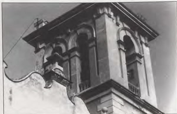
Iglesia del Pilar. Aspecto actual del último cuerpo del campanario.