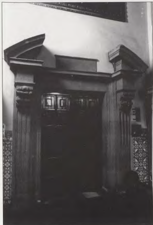
Iglesia del Pilar. Interior. Portada del crucero.