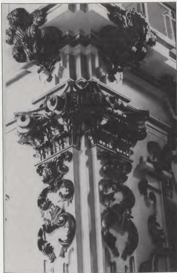
Iglesia del Pilar. Detalle del interior. Juego de capiteles compuestos en la esquina con el crucero.

salientes volutas, pero reduciendo la superficie exornativa y manteniendo una calidad y elegancia que dista mucho de la tosquedad de algunos templos de la época. Su aspecto recuerda al de la capilla de Comunión de Esteban (hacia 1696), en la capital, así como al de la iglesia de la Merced de Murcia. El enlucido de la parroquial de Agullent (Valencia) exhibe capiteles abultados muy anchos, asociables también con variantes a los de la iglesia que nos ocupa.