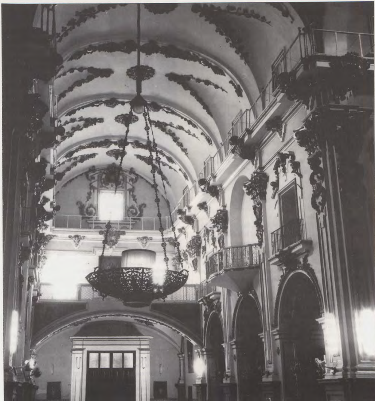
Iglesia del Pilar. Vista general del interior desde la capilla mayor.

Valentinam , para visitar a los enfermos del Hospital General, asistiéndoles al momento de la muerte, hizo que el lugar elegido fuese precisamente contiguo a dicho Hospital y a la cofradía de Santa Lucía, a poniente de la ciudad junto a la muralla trecentista, cerca