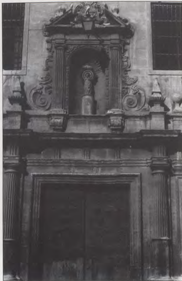
Iglesia del Pilar. Portada del imafronte (1730).

que yace inscrita, la rocalla que bordea el segundo cuerpo y los obeliscos de base gallonada son los elementos afines a la fecha de su construcción que se adhieren a una estructura arcaica para su época, respetándose además la superposición dórico romano-jónico. Incluso la combinación columna adosada-pilastra a cada lado del hueco responde a un esquema de mediados del Seiscientos, tal y como vemos en las portadas principales de la iglesia de los Desamparados; lo mismo que del último tercio de dicho siglo proviene el placado triangular de los zócalos de dichos soportes o el que bordea el nicho, o las ménsulas que sustentan las pilastras de éste último, de más larga tradición; pilastras que son estriadas lo mismo que las medias columnas que flanquean el hueco.