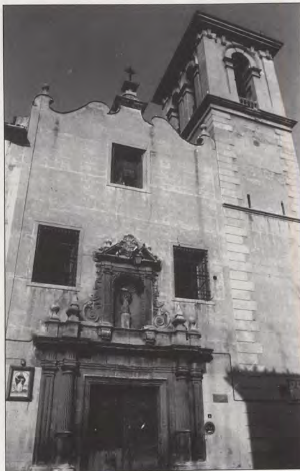
Iglesia del Pilar. Imagronte y campanario.

Supone un mantenimiento tardío desde fines del