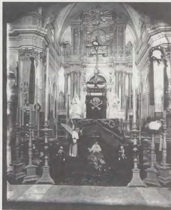
(Fig. 1). Retablo de la Iglesia de San Bautista de Manises (Valencia). Ejecutado por Salvador Escrig en 1805.

El cura párroco de Masanasa, cursa y presenta a la Junta de Arquitectura los planos para su aprobación de la Capilla de la Comunión de su Iglesia, ya que la existente estaba en muy mal estado, aunque pensaba que aún podría aprovecharse parte de la cubierta. El encargo se lo hacen a Salvador Escrig para que formase ese plan