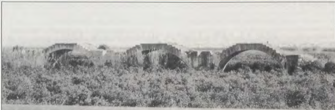
(Fig. 3). Puente sobre el Río Júcar (Alberique, Valencia). Construido por Joaquín Martínez y participación de Salvador Escrig. 1791.