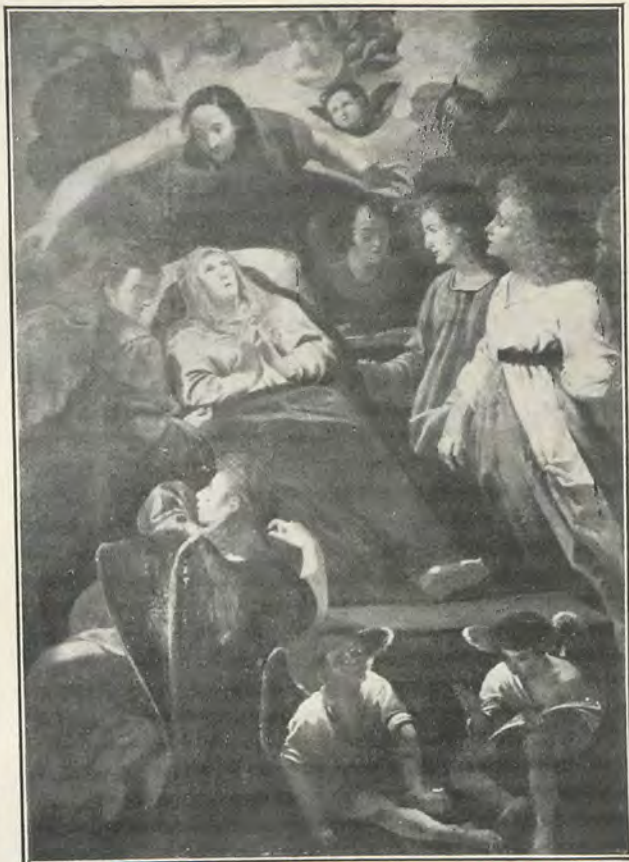
95.—JERÓNIMO RODRÍGUEZ DE ESPINOSA TRÁNSITO DE LA VIRGEN (Museo de Valencia)

Han desaparecido los libros de 1635 a 1650; los de 1657 a 1663 y de 1671 a 1677, falta que no hay forma de subsanar, pues en Valencia no existe padrón de vecinos del siglo XVII, fuera de los libros Confesionales , casi todos ellos incompletos, habiéndose perdido series enteras. A pesar de estas lagu-