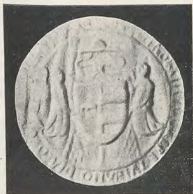
103.—RODRIGO DE BORJA Obispo de Valencia. 1458-1492 Placa

Es el más antiguo en fecha el de placa, en documento expedido en Roma a 17 de Enero de 1466 (4) . Es circular, de 045 milímetros; representa