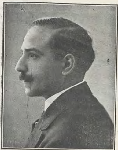
108.—D. MANUEL BENEDITO

EL Museo Provincial de Bellas Artes de Valencia ha sido favorecido durante el año 1915 con algunos donativos de cuadros y otros objetos artísticos. Pero el ingreso más importante débese al desprendimiento de un buen valenciano, D. Víctor Pedrer y Ramiro, señalado en los Anales de la Real Academia de San Carlos, por sus continuados esfuerzos a favor de la cultura local. Gran admirador de nuestro Museo y no menos de los artistas valencianos, notó la falta de una obra del insigne Manuel Benedito, procurando llenar el vacío. A este efecto adquirió el cuadro titulado Castiza , pintado por el laureado artista. Un lienzo de cortas dimensiones, pero en el que campea, con el arte singular de Benedito, una expresiva cabeza de castiza española, tocada con alta peineta y de la que pende, en pliegues de abolengo griego, la blondosa mantilla, marco en el que se destacan la figura de tonos cálidos y unos ojos de intensa y sugestiva luz meridional. Gracias al Sr. Pedrer, el