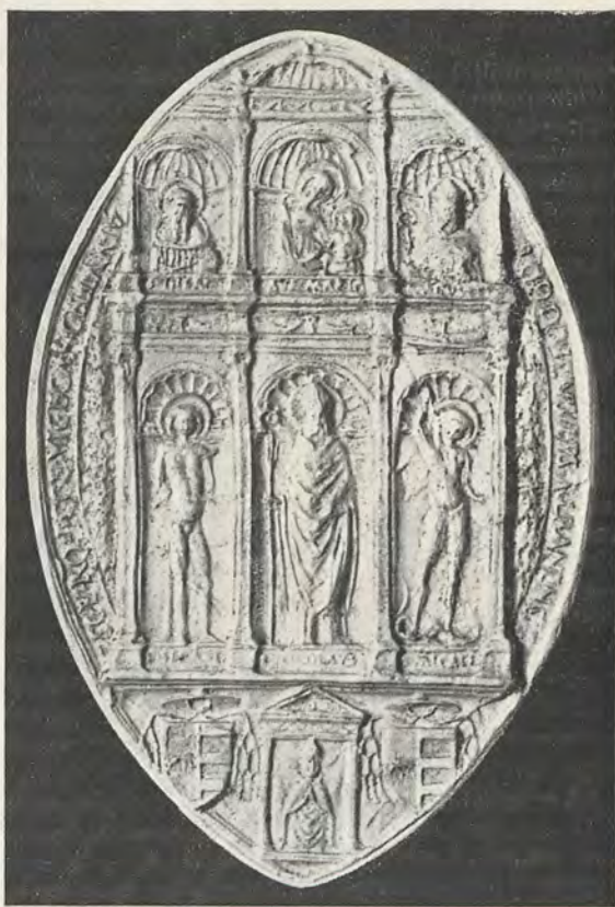
104.—RODRIGO DE BORJA Sello pendiente

El fragmento (7) del sello pendiente lo es del usado durante su legación en España. Es ya conocido, pues ha sido publicado con un detenido estudio por el Sr. Tormo (8) , utilizando un ejemplar custodiado en el Archivo Histórico Nacional (9) . Es tal su mérito, que en lugar de dar en este trabajo el fragmento de Valencia, se reproduce y estudia el ejemplar de Madrid, no obstante no ser inédito