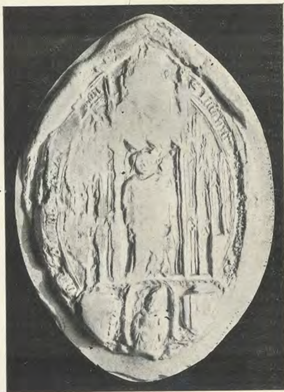
100.—JAIME DE ARAGÓN Cardenal, Obispo de Valencia

Hugo de Lupia y Bages, 1398-1427. —Muerto Jaime de Aragón, estuvo la sede de Valencia vacante algún tiempo y regida por un vicario nombrado por el papa (4) . Transcurridos unos dos años, y accediendo el pontífice a las reite-