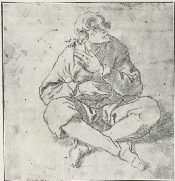
90.—J. J. DE ESPINOSA Estudio del natural. — Dibujo al lápiz 19 X 28 cm. (Museo de Valencia)

L a pintura valenciana adquiere, en los últimos años del siglo XVI, el matiz naturalista que arraiga en todas las escuelas de la época. Aparece en Valencia esta tendencia con Francisco de Ribalta (1551 ? † 1628) y con él puede afirmarse se cierra el brillante período del Renacimiento italiano, dando origen a un arte local, característico e inconfundible con otros coetáneos. Esta