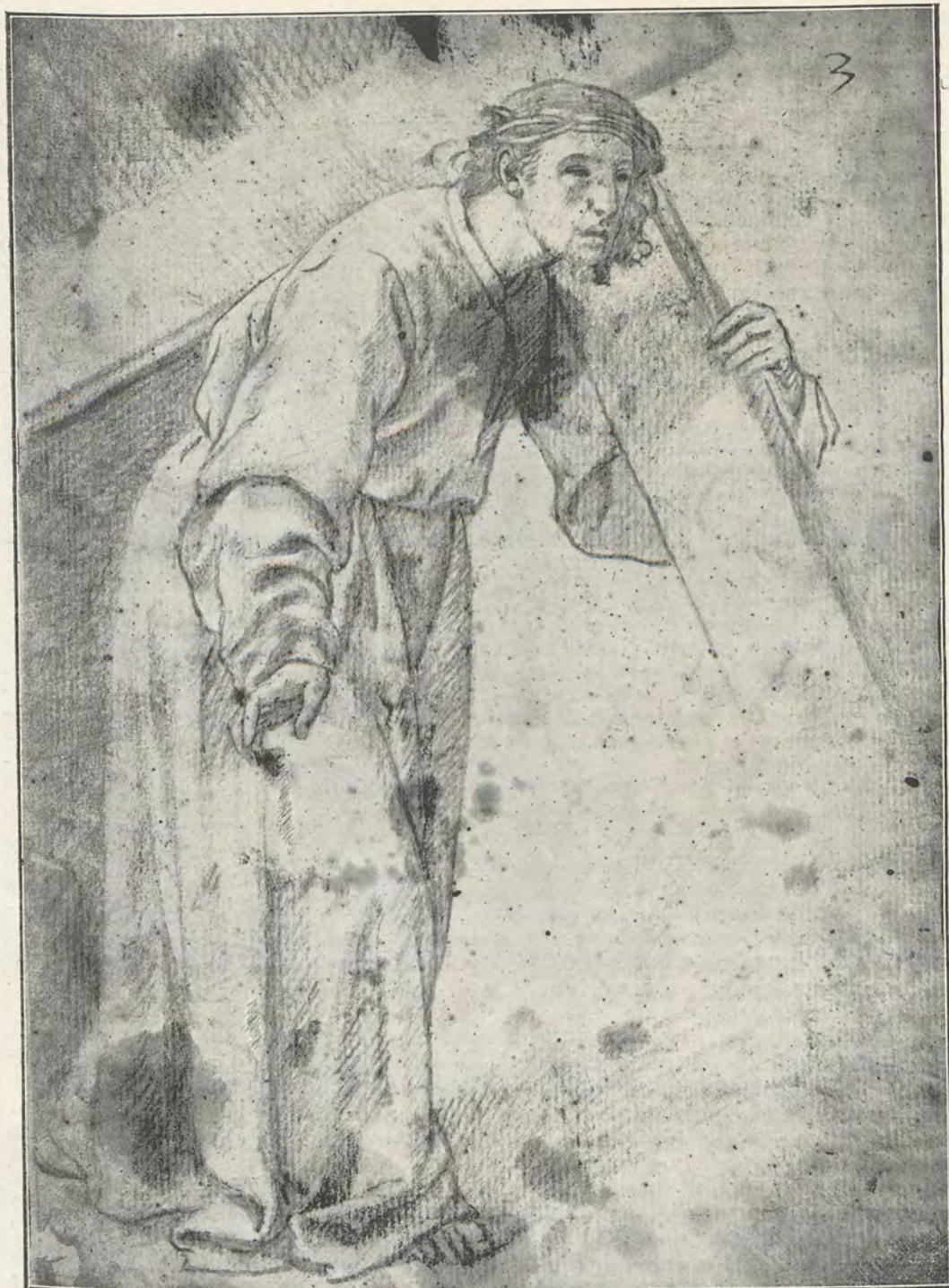
93.—J. J. DE ESPINOSA EL NAZARENO.—Estudio al lápiz para el cuadro Jesús apareciéndose a San Ignacio de Loyola en el Camino de Roma 19 x 27 cm. (Museo de Valencia)