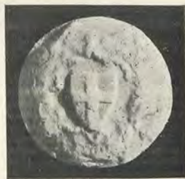
98.—VIDAL DE BLANES Contrasello

Es además uno de los casos más claros en que el sello anuncia el gusto artístico imperante en las obras de la catedral durante el nuevo pontificado. Al mismo arte ojival, con todos los detalles y características que el sello ofrece, corresponde la obra más importante debida a este obispo, la hermosa Aula capitular antigua, «augusto recinto del arte ojival» (5) , que hace sentir fuertemente la religiosidad y espiritualidad propias de este estilo, y que es una de las más preciadas producciones entre las de la catedral valenciana.