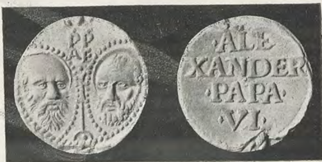
106.—RODRIGO DE BORJA Bula papal. Tipo 2.º

Pedro en la barca de pescador, y como leyenda en la parte superior, ALEXANDER · PP · VI.