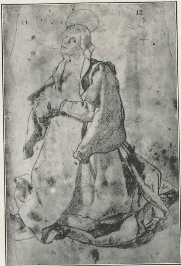
91.—J. J. DE ESPINOSA Estudio de ropajes. — Dibujo al lápiz 16 x 28 cm. (Museo de Valencia)

empresa sustraerse a los encantos de la prestigiosa labor artística del gran maestro valenciano. Obsérvese esto en la primera obra firmada y datada que conocemos de Espinosa II y con toda evidencia la que señala su aparición como maestro pintor, es decir, con personalidad jurídica, conforme al precepto gremial, para colocar su nombre al pie de los lienzos por él ejecutados. Existe esta obra en el convento de las monjas de Santa Tecla de Valencia, instaladas ahora en lo que fué Basílica de San Vicente de la Roqueta. El antiguo convento estaba emplazado en la calle del Mar y allí cerca, casi junto al convento, habitaba el artista con su familia. En la actual capilla del Cristo, llamado del Rescate, última del lado de la Epístola, se puede admirar la obra juvenil