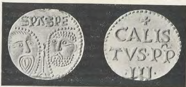
102.—ALFONSO DE BORJA Bula papal

en la parte superior, S PA S PE ; en el reverso, en cuatro líneas, + | CALIS | TVS · PP · | · III · Responde por completo a un tipo arcaico, bien apreciable