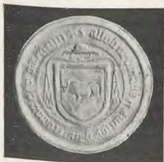
101.—ALFONSO DE BORJA Obispo de Valencia. 1429-1455

Es pertinente presentar el sello que empleó como papa, pues aunque no forma parte de la serie episcopal valenciana, completa el conocimiento de los usados por él, y permite conocer cuáles fueron en este aspecto sus aficiones artísticas. Es una bula (8) , de plomo, según costumbre, de 0'035 milímetros, representando en el anverso los bustos de San Pablo y San Pedro, y como leyenda,