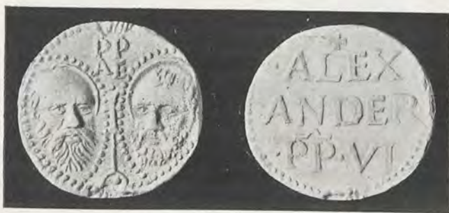
105.—RODRIGO DE BORJA

En los del primer grupo (3) las cabezas de S. Pablo y S. Pedro no son los modelos arcaicos de las de Calixto III, sino cabezas en los que se copia el natural; y la leyenda, SPA SPE, no está en línea recta, sino en dos paralelas de letras superpuestas. El reverso, tratado al modo de los de Calixto, dice: + | · ALEX | ANDER · | · PP · VI ·