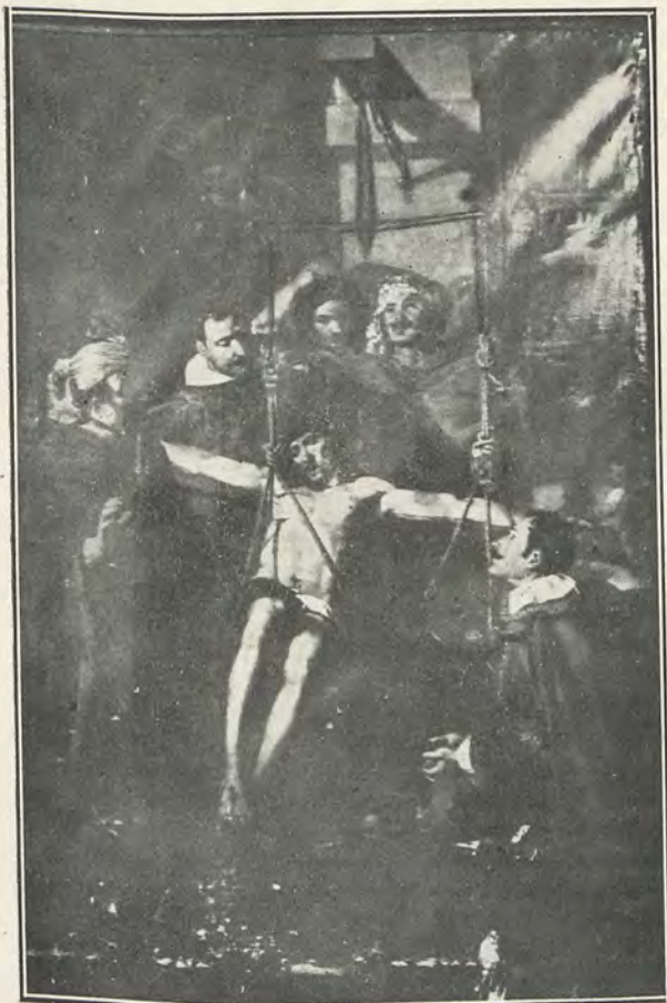
96. — J. J. DE ESPINOSA CRISTO DEL RESCATE Obra de 1623 (Monjas de Santa Tecla, Valencia)

Item, prencch de mos bens per anima mia y dels meus y de tots fels difunts y en remissio de mos Pecats, quaranta lliures moneda reals de Valencia, de les quals vull siga pagada la mia sepultura y funeraries, y, de lo que sobrara, fetes dites cosses, vull y es ma voluntat, per dit mon marmesor sia distribuït en fer dir y celebrar les mises de requiem següents. Primerament en lo altar y capella del santxpo de sent salvador sinch mises de requiem; ab idem en lo altar y capella de sant sepulcre de sent Berthomeu, sinch mises de requiem ab sos misereres unes y altres. Y ultimament en fer dir y celebrar en lo Real Convent del Patriarca sent Domingo, lo trentenari del Pare sent Vicent ferrer, en altars privilegiats y si acas sobrara alguna cantitat, vull sia distribuït en fer dir tantes quantes mises de requiem se podran