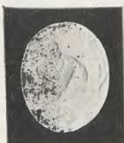
107.—R. BORJA Anillo del pescador

0'022 × 0'018 milímetros, y representa a San